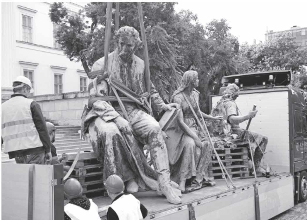
Arany János szobrát emelik daruval egy teherautóra az Arany János-szoborcsoport elszállítása során a Magyar Nemzeti Múzeum kertjében 2017. szeptember 7-én

A kétszer meghosszabbított pályázati határidőre tíz pályamű érkezett be, és a bizottság az első díjat Stróbl Alajosnak ítélte oda. A szobrász Arany arcának megformálásához a költőről készült fotókat és Izsó Miklós portrészobrát tanulmányozta, a szoborcsoport egyik mellékalkaja, Toldi arcához pedig egy ismeretlen békési magyar parasztember portréját használta, míg magához az alakhoz Porteleky László vívóbajnok és a Magyar Atlétikai Club számos atlétája ült modellt. A szobor másik mellékalkaját, Piroskát a múzeumalapító Széchenyi Ferenc gróf dédunokájáról, Széchenyi Alice-ról mintázta Stróbl Alajos. (MTI)