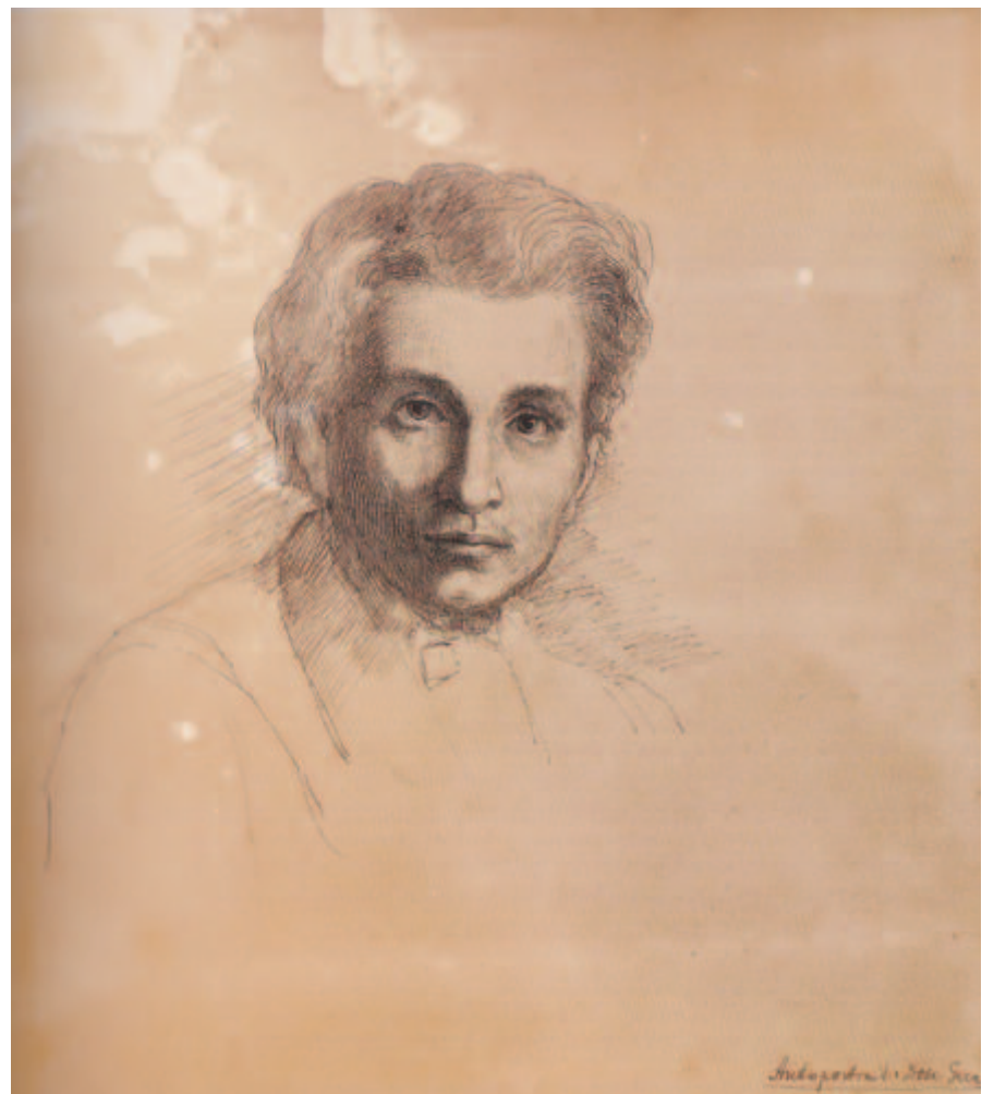
Dósa Géza önarcképtanulmánya