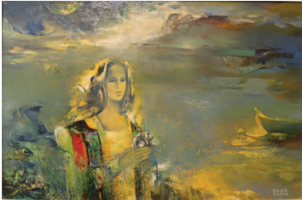
A tenger leánya

A munkák a festő különböző periódusaiból származnak, a rendezők időrendi sorrendben helyezték őket a falakra. Jól érzékelhető, hogy festészete nagyjából évtizedenként megújult. Hangsúlyokban, színekben, technikai megoldásokban tapasztalható a változás, de az is nyilvánvaló, hogy sajátos látásmódját, a valóság szubjektív megközelítését mindmáig megőrizte. Festői világa, a „magasabb síkra emelt, átköltött” realitás szavakkal aligha visszaadható, kompozíciói viszont annál beszédesebbek. A képcímekből is sok mindenre következtethetünk. Forrásvidékükre mindenképpen. Érdemes egy kísérletet tennünk. Gyúrjunk összefüggő szöveggé néhányat a címek közül, az eredmény mindazt sugallja, ami a művész női érzelmi, eszmei, hit- és álombeli sajátja.